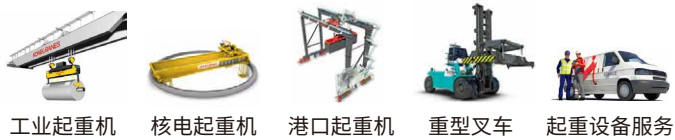
工业起重机 核电起重机 港口起重机 重型叉车 起重设备服务