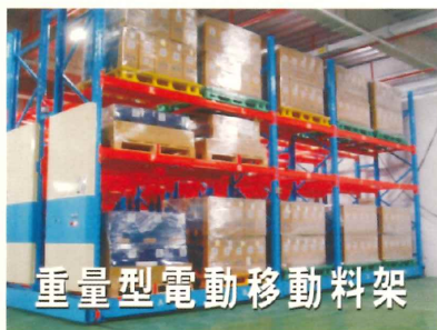
重量型電動移動料架