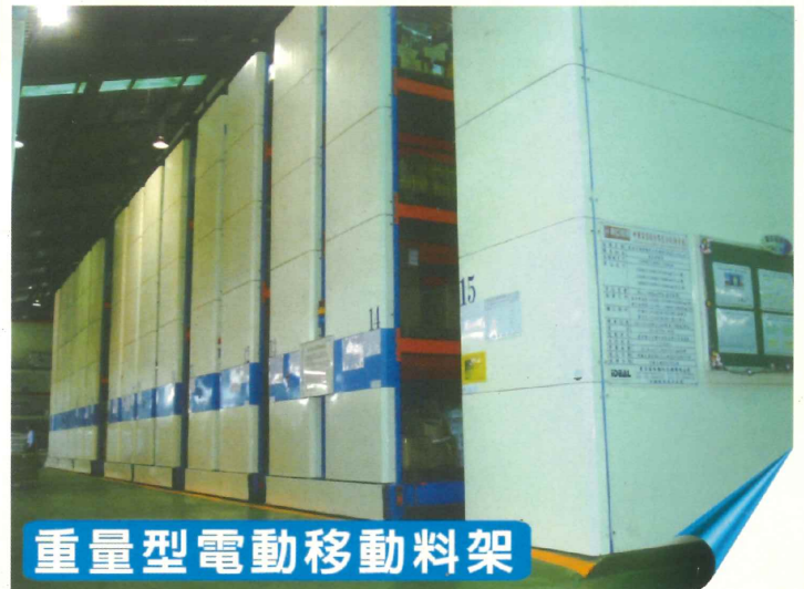
重量型電動移動料架