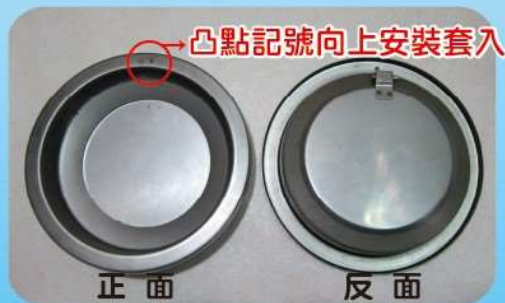
逆止風門室內裝置結構